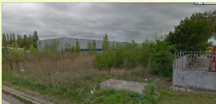
Pohľad pred realizáciou projektu

Podnikateľský inkubátor má potenciál stať sa regionálnym centrom pre poskytovanie vysokokvalitných služieb v oblasti technológií a outsourcingu administratívy, čo prispeje k pozdvihnutiu úrovne služieb v Komárne a jeho okolí, a bude mať pozitívny vplyv na vytváranie pracovných miest a to aj na vysoko kvalifikovaných odvetviach.