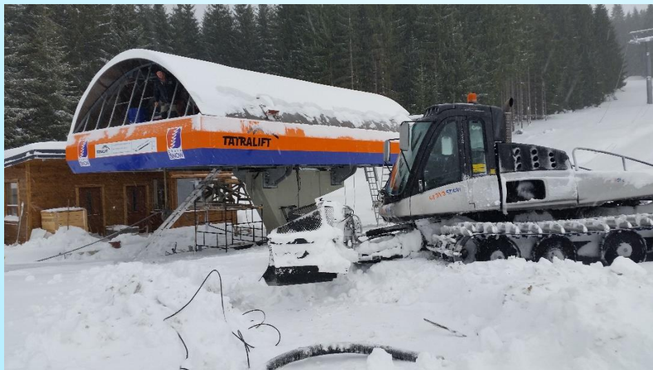
Fotografia po realizácii projektu

Cieľom projektu je rozvoj rekreačných služieb lyžiarskeho strediska, nárast aktivity strediska, konkurencieschopnosti žiadateľa a celkový rozvoj regiónu zvýšením jeho atraktívnosti ako aj vytvorením nových pracovných miest.