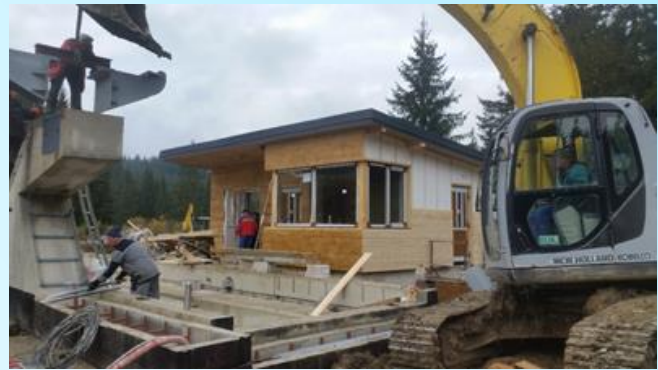
Fotografie počas realizácie projektu.

Miesto realizácie projektu: Oravská Lesná