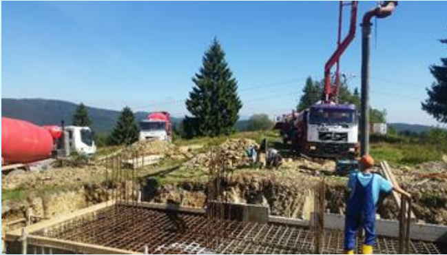
Fotografia pred realizáciou projektu.

Oblasť 1 Investície spojené s vidieckym cestovným ruchom a agroturistikou