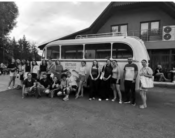
Jazda historickým autobusom

o osobných cieľoch. Skupina navštívila Dudince, kde sa zúčastnila na diskusiách o význame prírodných zdrojov, nasledovali aktivity v komunitnom lese. Deň sme zakončili hodnotením vo dvojiciach a skupinách pri fontáne v Dudinciach a medzikultúrnym večerom plným hudby, tance a ochutnávok jedál z rôznych krajín.