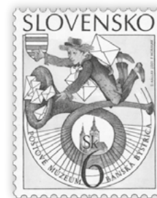
obr. 4 Poštové múzeum, Banská Bystrica

kde mala 56 preprahacích staníc. V centrách niektorých miest, ktorými cesta prechádzala, boli nedávno osadené pamätne žulové dlaždice s emblémom cesty Magna Via. Je najstaršou a najdlhšou historickou cestou našej krajiny. Stanice, poskytujúce nocľah, stravu a oddychnuté kone, boli od seba navzájom vzdialené 2 poštové míle (asi 15 km). Prepravcovia, zvaní „postilióni“, svoj príchod na koňoch alebo s poštovými vozmami (diligenciami) oznamovali trúbkou, ktorá zostala symbolom pošty dodnes.