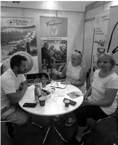
Fotoreportáž zo spoločnej prezentácie SZVT a VIPA na výstave Agrokomplex 2024 v Nitre.

Slovenský zväz vidieckej turistiky (SZVT) a Vidiecky parlament (VIPA) sme boli súčasťou Agrokomplexu v pavilone M2, prezentovali sme našu prácu, absolvovali mnohé stretnutia a rozhovory, boli sme súčasťou odborného sprievodného programu v pavilóne M3 s témou: Príprava zákona na zriadenie Fondu na podporu cestovného ruchu a schémy štátnej pomoci a Príklady dobrej praxe podnikania vo vidieckej turistike, agroturistike.