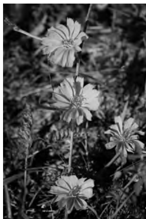
Čakanka obyčajná

ROZŠÍRENIE A VÝSKYT: Na území Slovenska je hojne rozšírená, rastie ako burina, ojne rozšírená od nížin po podhorský stupeň, najmä pri cestách, na suchších lúčach, medziach a rumoviskách.