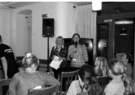
Debata o riešení problémov

horské pasienky a sezónne sťahovanie salaša prebieha vertikálne, na jar – z nižších nadmorských výšok do vyšších a na jeseň späť. Na Slovensku existuje aj horizontálna transhumancia, pri ktorej salašníci a ich hospodárske zvieratá migrujú z letných pasienkov, ktoré sú vzdialenejšie od ich obydli, na zimné pasienky v blízkosti svojich domov, kde okrem pasienkov vypásajú aj polia po žatve a kosbe. Hlavným produktom salašníctva boli a aj v súčasnosti sú mliečne produkty. Spracovávala sa aj vlna, mäso a koža. Na salašníctvo, a predovšetkým tradičné ovčiarstvo sa viaže množstvo foriem živého dedičstva, ktoré sa spája s výrobou produktov, ale aj slávením