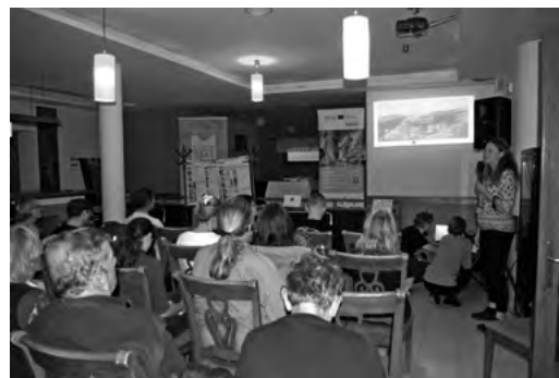
Prednáška počas workshopu

Zástupcovia WWF Slovensko reprezentovali vedecké výstupy dokladujúce škody na hospodárskych zvieratách spôsobené veľkými šelmami. Vysvetlovali okolnosti a súvislosti útokov veľkých šeliem. Spoločne sme hľadali východiská pre spolužitie človeka