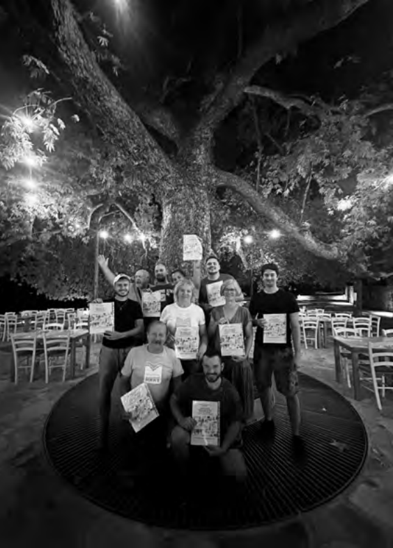
Účastníci inšpiratívnej vzdelávacej aktivity na Cypre

ným a severným Cyprom. Nikózia je jediné rozdelené hlavné mesto v Európe, čo výrazne ovplyvňuje každodenný život jej obyvateľov a identitu celého ostrova. Účastníci lepšie pochopili historické, kultúrne a sociálne aspekty, ktoré formujú moderný Cyprus.