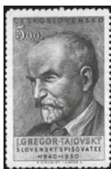
obr. 7 Jozef Gregor Tajovský

meste Nadlak a v Prešove ako vedúci bankovej filiálky. Ako vojak rakúsko-uhorskej armády bojoval na východnom fronte. Dobrovoľne padol do ruského zajatia, stal sa aktívnym účastníkom zahraničného odboja. Od roku 1917 bol členom československých légii v Rusku, odkiaľ sa po vojne vrátil (cez Japonsko a USA) naspäť na Slovensko. Usadil sa v Bratislave a do roku 1925 pôsobil v službách československej armády ako prednosta legionárskej kancelárie. Po odchode do výslužby sa naplno venoval rozsiahlej literárnej činnosti – poézii, krátkej próze, divadelným hrám. Je považovaný za zakladateľa slovenskej realistickej drámy. Bol výborný pozorovateľ a svoje skúsenosti bez prikrášľovania prenášal do svojich diel. Z najznámejších spomeňme Maco Mlieč, Mamka Pôstková, Apoliena, Statky-zmätky, Ženský zákon. J. G. Tajovský zomrel 20. mája 1940 v Bratislave, ale jeho telesné pozostatky boli prevezené do rodnej obce Tajov, kde bol 25. mája 1940 pochovaný na miestnom cintoríne, sym-