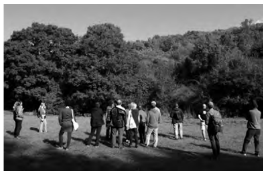
Exkurzia v NPR Kečovské škrapy

Pre zvládnutie náročných situácií pomáhajú príklady úspešných riešení z praxe a konštruktívna debata, ktorej cieľom je nájsť východiská z problémov.