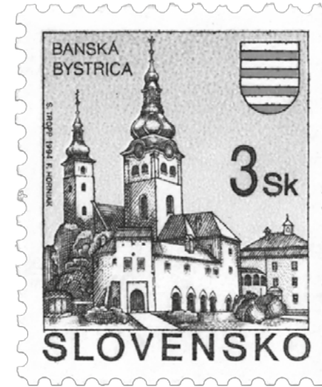
obr. 12 Banská Bystrica, 1994