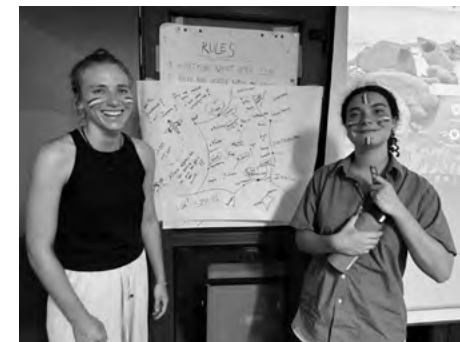
Francúzky prezentujú svoju krajinu

Hlavným cieľom projektu bolo poskytnúť účastníkom praktické nástroje a metódy, ktoré by mohli využiť pri práci s mládežou, a to predovšetkým v oblasti environmentálnej edukácie a komunitného rozvoja. Projekt zdôraznil význam aktívneho zapojenia mladých ľudí do ochrany prírody a podporu udržateľného rozvoja ich lokálnych komunit. Počas celého týždňa sme využívali toolkit (súbor nástrojov), ktorý sme vytvorili v rámci strategického partnerstva Erasmus+ v minulosti: https://www.yafnaw.eu/toolkit