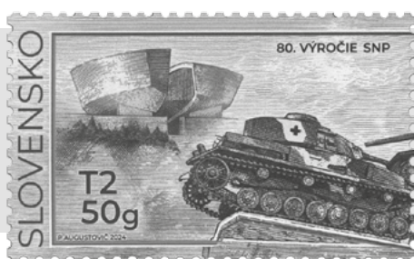
obr. 3 Znáмка k 80. výročiu SNP

S kôr, než sa prejdeme po Banskej Bystrici – pre tých, čo nepoznajú Magna Via – krátka informácia: pomenovanie Magna Via patrí starej cisársko-kráľovskej poštovej ceste v Rakúsko-Uhorsku, ktorú vybudovali po bitke pri Moháči (1526), keď Turci obsadili stred mo-