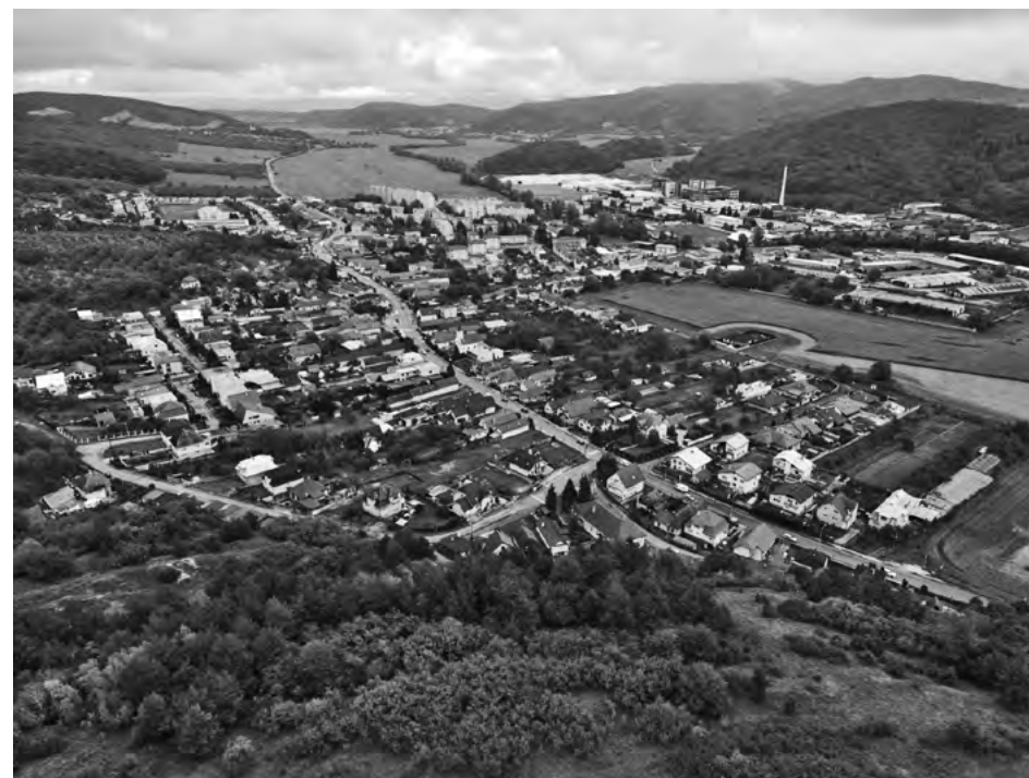
Dolné Vestenice z vtáčej perspektívy .....

Podrobnejšie údaje o postavení Dolných Vesteníc, o hospodárskych pomeroch a sociálnu štruktúru obyvateľov sa dozvedáme až z urbárov v 17. storočí. ( Urbarium Cathedralis Ecclesie Nitriensis 1626 a 1694). Boli správnym hospodárskym centrom biskupských majetkov – tzv. officiolátu. Hospodársky základ tvorilo 18 a 3/4 sesíi urbári-