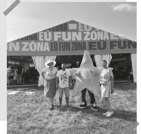
Tím dobrovoľníkov VPMS bol na Pohode prezentovať Európsku iniciatívu občanov. Prajeme Vám pohodovú jeseň!