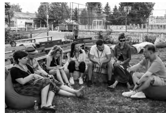
Pracovná skupina k rozšíreniu ERYs do ďalších krajín Európskej únie

Jedným z hlavných momentov podujatia bola aktivita „Rural Youth Talks“, počas ktorej mladí ľudia z rôznych vidieckych oblastí zdieľali svoje osobné príbehy, výzvy a úspechy. Táto aktivita ponúkla účastníkom možnosť hlbšie porozumieť problémom,