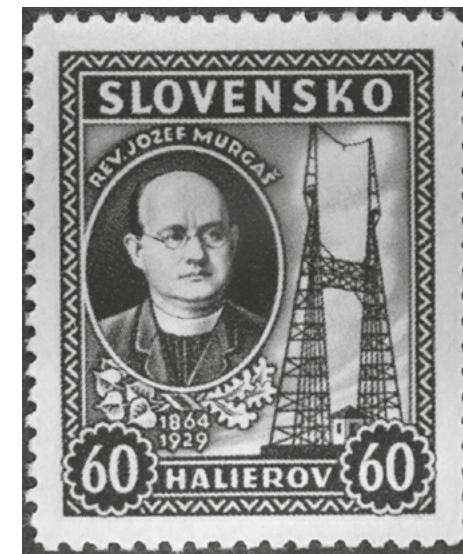
obr. 8 Jozef Murgaš

Skôr, než prejdeme k technike a ďalším oblastiam Murgašovho úspešného pôsobenia, zostaňme pri umení. V Literárnom a hudobnom múzeu (v priestoroch Štátnej vedeckej knižnice v B. Bystrici) práve v čase písania tohto príspevku, otvorili pri príležitosti 160. výročia Murgašovho narodenia výstavu „Viera, veda, umenie z Tajova do Wilkes-Barre“ (od 17. 9. do 28. 11. 2024). Prvý krát v histórii sú na jednom mieste predstavené 3 desiatich jeho maliarskych diel. Je neodmysliteľné, že výstavu dopĺňali exponáty bezdrôtovej telegrafie i ďalšie vynálezy J. Murgaša. Veď práve on bol prvým človekom na svete, ktorý uskutočnil bezdrôtový prenos ľudského hlasu. Tento svetový unikát sa podaril Murgašovi v r.1905,