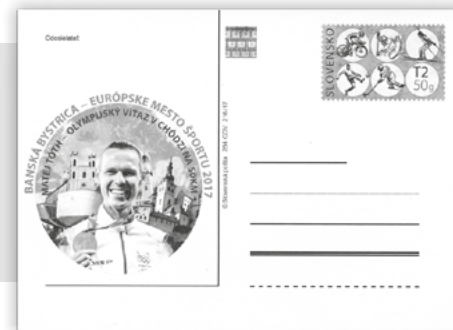
obr. 10 Olympijský víťaz Matej Tóth

S mestom Banská Bystrica je nerozlučne spojené meno Matej Tóth (Obr. 10). Narodil sa 10.2.1983 v Nitre, ale slávu získal ako pretekár klubu VŠC Duk-