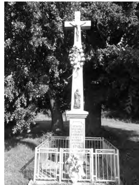
Križ chorvátskych obchodníkov z 18. storočia

V rokoch 1928-1929 mrazy zničili väčšiu časť ovocných stromov. Keďže vesteničiar sa špecializovali na ovocinárstvo, snažili sa tieto škody rýchlo nahradiť. Uskutočnila sa hromadná výsadba nových stromkov a obchodovalo sa aj s „ovocím na koreni“ – to