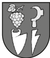
Erb obce Horné Vestenice

Na území dnešnej obce Horné Vestenice bolo slovanské pohrebisko z 10.-12. storočia. Obec sa vyvinula zo slovanskej osady v 11. storočí. Doložená je z rokov 1332-1337 ako Vestinic , z roku 1349 ako Wezthenicz ouperior , z roku 1773 ako Horne Westenice , maďarsky Felsővestenic , Felsővestény . Patrila panstvu Skačany, od roku 1777 nitrianskej kapitule. V roku 1663 bola poplatná Turkom. V obci bolo mýto, dopravná a poštová stanica. V roku 1553 mala 12 port, v roku 1715 mala 25 domácností, v roku 1778 mala