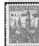
obr. 11 B.I.T. 1937, Banská Bystrica

Rarita? Poštová známka Banská Bystrica vydaná 4x! (Obr. 11) V roku 1936 vydala československá pošta novú emisiu Hrady, krajiny a mestá . Jednu z 10 výplatných známok bola Banská Bystrica. Zaujímavé je, že táto poštová známka sa na trhu objavuje druhýkrát v roku 1937, ale v mierne odlišných tónoch pôvodnej farby, s prítlačou „B. I. T.