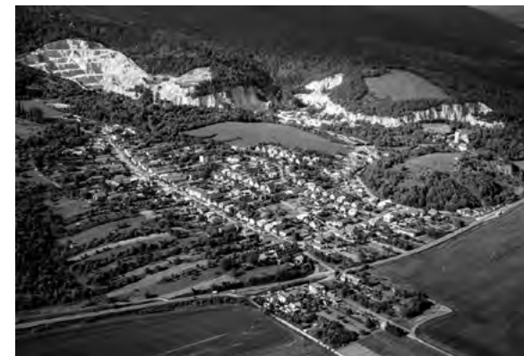
Letecký záber na Horné Vestenice

znamenal, že vesteničiar kupovali z jari budúcu úrodu, hlavne v Moravciach, Látkovciach a Klátovej Novej Vsi.