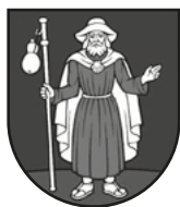
Erb obce Dolné Vestenice .....

Vestenická dolina prešla ťažkou skúškou histórie. Neobišli ju nové myšlienkové prúdy, vnútropolitické otrasy v 16. storočí a stála vo víre politických a vojenských akcií počas celého 17. storočia. Boľavé rany zanechali v živote jej ľudu najmä ničivé stavovské povstania a turecké výboje.