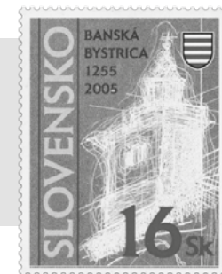
obr. 13 Banská Bystrica, 750. výročie udelenia mestských privilégií Belom IV.

1937“ ( Bureau International du Travail ) k zasadaniu Medzinárodného úradu práce v Prahe. Tretí krát sa objavuje pôvodná známka so šikmou modrou dvojriadkovou pretlačou „Slovenský štát/1939“. Vyimochne je, že táto známka bola požitá aj štvrtý krát, ale v Protektoráte Čiech a Moravy v pretlačovom provizóriu: s textom „BÖHMEN u. MÄHREN/ČECHY a MORAVA“.