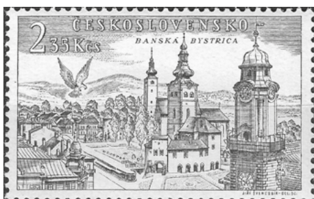
obr. 2 Banská Bystrica na známke z roku 1955