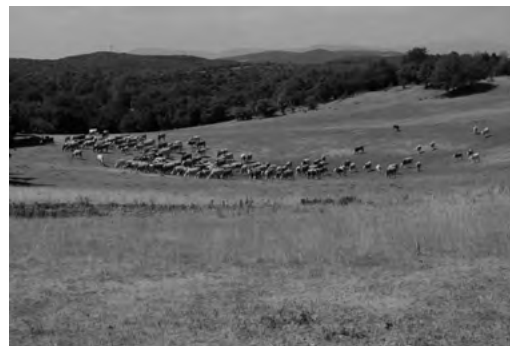
Krasové planiny ako sezónne pasienky

N árodný park Slovenský kras je chránená oblasť s prírodným dedičstvom svetového formátu a sčasti sa prekrýva s oblasťou výskytu ikonických jaskýň Slovenského a Aggtelekského krasu,