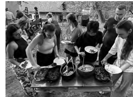
Spoločná príprava večere

Utorok: Vymikajúce aktivity na začatie štruktúrneho myslenia. Vedená meditácia uprostred dňa pomohla uvoľniť sa a zopakovať si aktivity z prvej časti dňa. Bowling pomáhal zvládať stres a pomáhal zvyšovať tímového ducha. Poznatky z týchto aktivít pomáhali aj počas celého tréningu.