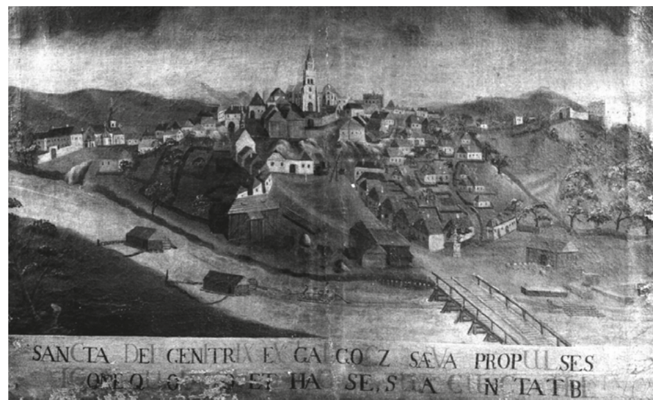
Podoba Hlohovca na obraze z polovice 18. stor.