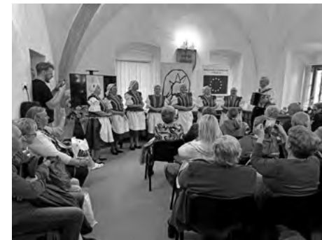
Folklórna skupina Vinička z Novej Bane