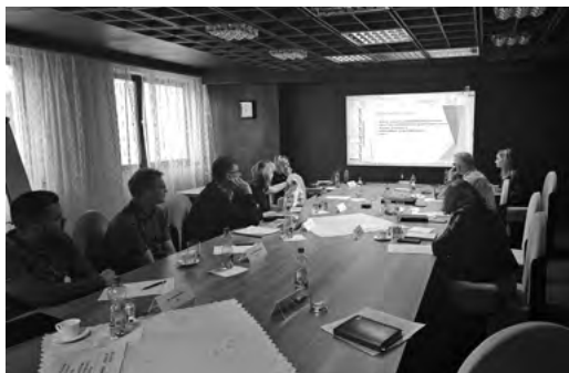
Pracovné stretnutie v Nitre