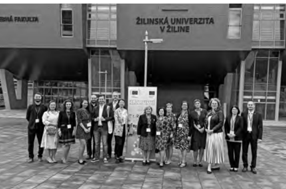
Tím pracovníkov siete Europe Direct na Slovensku

Súťaž Mladý Európan si kladie za cieľ zvýšiť povedomie o participatívnom občianstve EÚ medzi stredoškolskými študentmi a vytvoriť priestor pre inovatívne mysle mladej generácie, poskytuje jedinečnú príležitosť študentom preukázať svoje vedomosti a kreativitu, zatiaľ čo sa zoznamujú s dôležitými európskymi témami.