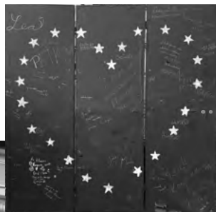
Spoločná výtvarná aktivita účastníkov osláv

Tešíme sa na vašu účasť v novom centre, kde na vás čakajú bezplatné materiály, brožúry a interaktívne aktivity. Sledujte nás na našej stránke edbanskobystrickyregion.eu pre ďalšie informácie o nadchádzajúcich podujatiach a projektoch, ktoré vám umožnia hlbšie pochopiť a zažiť Európsku úniu.