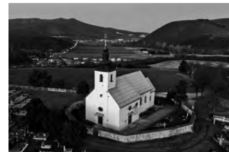
Kostol sv. Barnabáša, Hradište