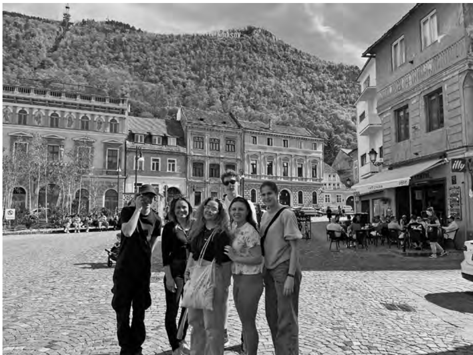
Výlet do Brasova, kde prebiehali rozhovory s mladými ľuďmi o EÚ

boli rozdelení do novinárskych spoločností a tých čo im boli kladené otázky. Táto aktivita bola taktiež veľmi zábavná, ale aj veľmi poučná, keď sme sa mohli viacej vžiť do role novinárov a naživo sledovať ako sa spomenuté informácie prekrúcajú a menia na úplne niečo iné. Posolstvom týchto workshopov bolo porozumieť práci médií a obsahu na sociálnych sieťach a donútiť nás vždy si všetko overiť a spraviť si na to vlastný názor.