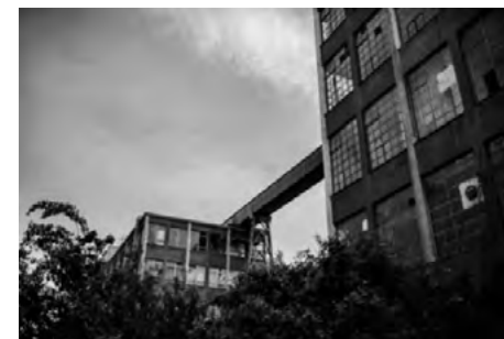
Bývalá fabrika Baťa v Partizánskom