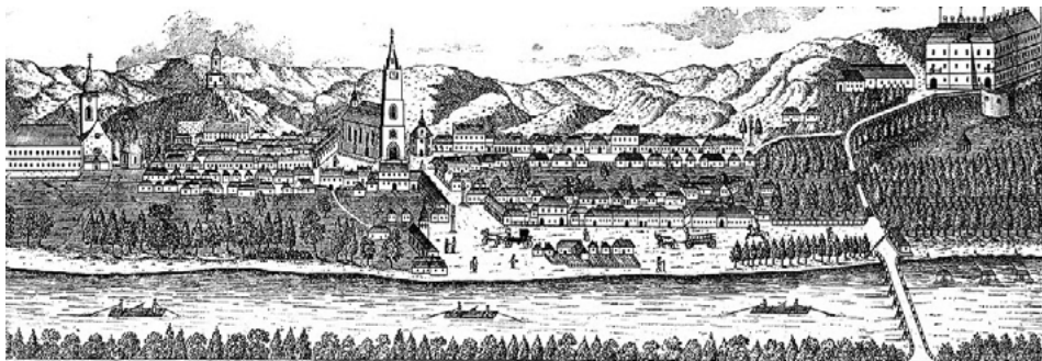
Veduta mesta Hlohovec zo začiatku 19. stor.

charizme rozpoznal najvznešenejšiu podobu človeka, ktorá podľa neho zaručuje budúci rozkvet ľudstva ako takého a tvorí „výbornú látku“ pre umelecké spracovanie. Dodáva tiež, že každý, kto môže, by mal tento kraj spoznať na vlastnej koži.