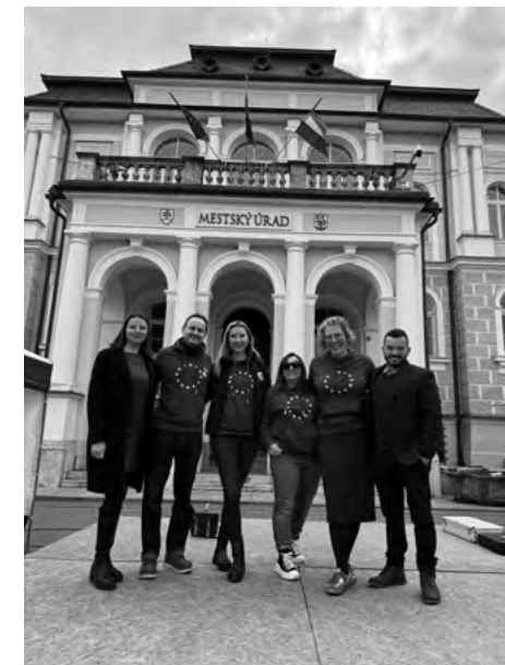
Organizátori osláv spolu s hosťami zo Zastúpenia EK na Slovensku

Podujatie sa nieslo v duchu európskej kultúry a ponúklo bohatý program, ktorý zahŕňal hudobné a tanečné predstavenia a výtvarné aktivity. Prítomní mohli interaktívne spoznávať Európsku úniu pros-