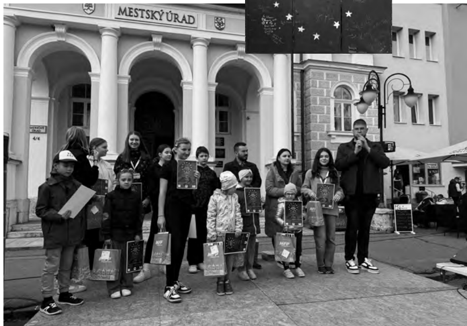
Výhercovia výtvarnej súťaže