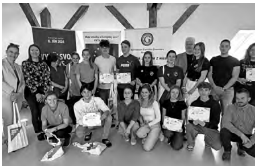
Súťažiaci v regionálnom kole