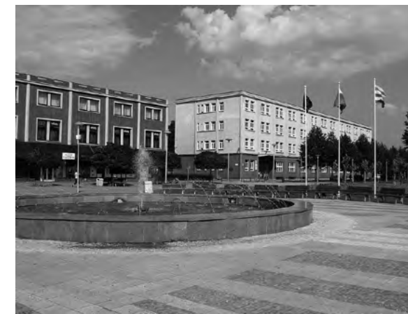
Námestie SNP v Partizánskom .....

Fabrika 61 tak reaguje na aktuálne potreby regiónu a zároveň chráni významné kultúrne dedičstvo pre ďalšie generácie. Fabrika umenia je kultúrne – komunitná platforma, ktorá v Partizánskom rozvíja umenie a kultúru. V projektoch hľadá fúziu medzi kvalitnou a umeleckou rovinnou oslovovaním komunity s dôrazom na jej budovanie a rast. Pre Fabriku umenia je dôležité prinášanie nových kultúrnych formátov, rovnako ako aj budovanie povedomia o hodnotách architektúry mesta. Organizuje kultúrne podujatia pre verejnosť, pamiatkové sprevádzania, diskusie, vytvorila sprievodcu po architektúre v tlačenej aj webovej podobe, je iniciátorom turisticko – informačnej kancelária Baťa point. Poslaním Fabriky umenia je budovať kultúrne – komunitný priestor v Partizánskom, ktorý podnieti umenie a prispeje k rastu kultúry, mesta, regiónu, ale hlavne človeka ako takého.