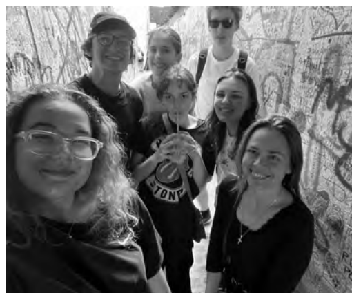
Výlet do Brasova