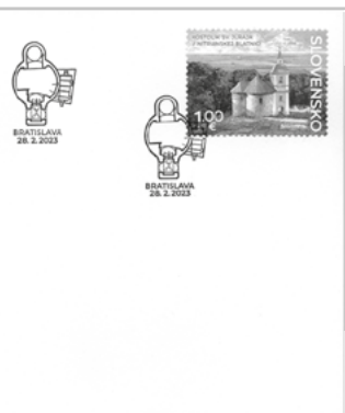
Jurko, Nitrianska Blatnica, FDC

V súťaži o najkrajšiu obálku prvého dňa vydania známky (FDC), v ktorej hlasovalo o stovku účastníkov menej, znova rezonovala nám blízka téma – „Jurko“ v Nitrianskej Blatnici. V tejto súťaži sa „Jurko“ umiestnil na druhom mieste, za FDC „Ochrana prírody: Včela medonosná“ a pred FDC „Umenie: Gotická cesta – oltár v Kostole Zvestovania P. Márie v Chyžnom“. Pestrosť umeleckého stvárnenia obálok FDC postavila hlasujúcich pred náročný problém – ktorú z nich označiť za NAJ-. Aj tu sa medzi prvými 3 prejavil iba 10 bodový odstup (61 až 86). Ale ďalšie 3 nemali medzi sebou viac ako 8 hlasov (50 - 58), čo svedčí o pútavom grafickom spracovaní FDC.