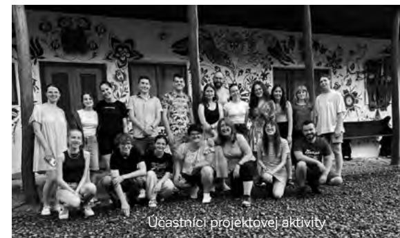
Účastníci projektovej aktivity

Ďalší deň sme si priblížili rolu lídra alebo podnikavca na vidieku, kde sme analyzovali vlastnosti, aký by mal alebo nemal byť správny líder. Neskôr