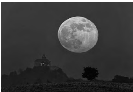
Modrý mesiac – Blue moon .....