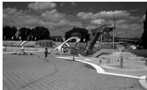
Partizánske – mestské kúpalisko Dúha .....