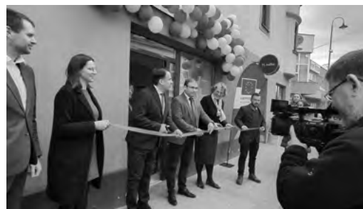
Slávnostné otvorenie kancelárie Europe Direct

Program bol doplnený o stánky s občerstvením, kde návštevníci mohli ochutnať okrem bežných pochutín aj talianske špeciality v podaní študentov SOŠ v Krupine.