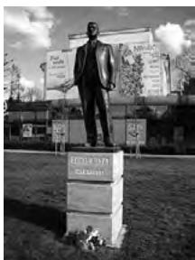
Socha Tomáša Baťu .....

Dobové písomné materiály, ktoré má k dispozícii Štátny archív, predstavila účastníkom sympózia