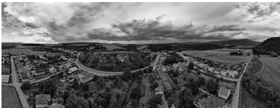
Panoráma obce Hradište

Prístup vedie asfaltovou cestou až priamo ku kostolíku alebo je možné auto nechať aj na malom štrkovom parkovisku pod kostolíkom, pri bývalom kameňolome. Predpokladá sa však, že osada Hradište vznikla v druhej polovici deviateho storočia, teda dvesto rokov pred postavením kostola. Románsky kostol v Hradišti má 900 rokov a bol postavený okolo roku 1096. Stojí neďaleko obranného valu, ktorý