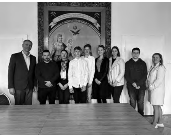
Účastníci pracovného stretnutia v Novej Bani

Následne sa 21. mája konalo online stretnutie členov MMP a vedúcich členov VPMS kde sme sa bližšie zoznámili, hovorili o svojej motivácii spolupracovať na veciach verejných a započali sme plánovanie ďalších aktivít ako je analýza stavu a potrieb mladých ľudí v meste Nová Baňa. Čaká nás veľa práce, ale veríme že to bude stáť za to. ☺